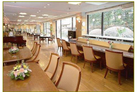
1階ラウンジ&バーカウンター

千川上水が流れる静かな住宅地に加えて、市民公園や公営スポーツ施設にも隣接 緑多き快適環境の中、ハイケア対応の充実システムを装備した施設です。