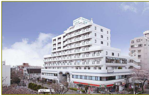
建物の外観(土地建物の権利形態:賃借)