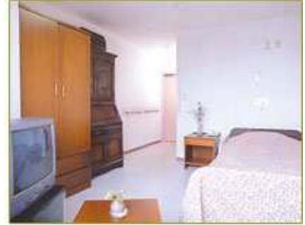
シングルルーム508号室

J R 武蔵境駅から、わずか3分(約200m)の好立地。シティホテル感覚のホームです。 お元気な方はもちろん、生活全般で介護が必要な方も心を込めてお世話いたします。