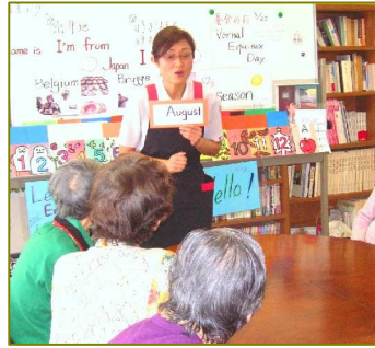
英語サークル「声を合わせて、オーガスト！」