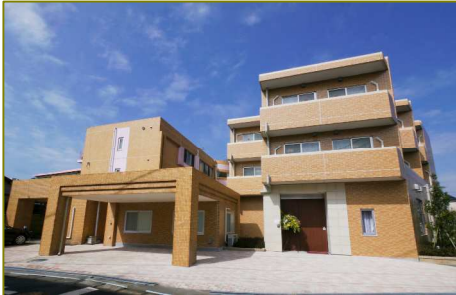
建物の外観(土地建物の権利形態:賃借)